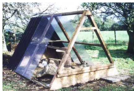
Beispiele für gelungene Freigehege

Kaninchen werden im Alter von etwa 4 Monaten geschlechtsreif. Man kann einen Rammler ab ca. der 10. Woche kastrieren lassen, das ist aber von Tier zu Tier unterschiedlich. Bei zwei Rammlern sollte man das so früh wie möglich machen lassen. Schädlich ist das auf keinen Fall, wenn es ein guter Tierarzt ausführt, der sich mit Kaninchen auskennt. Wenn die Rammler erst mal geschlechtsreif geworden sind, werden sie sich nicht mehr vertragen und es kann wirklich schlimme Kämpfe mit gefährlichen Verletzungen geben. Wenn man sie kastrieren lässt, besteht die Chance, dass sie sich vertragen werden. Das ist aber auch nicht garantiert. Zwei Rammler können sich, auch wenn sie früh kastriert wurden, später nicht verstehen. Es ist daher besser ein Pärchen zu kaufen – gerade dann sollte aber rechtzeitig kastriert werden(!) – Kaninchen sind noch Tage nach der Kastration zeugungsfähig! (Quelle Internet)