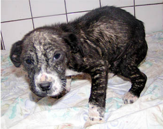
Cleo am Fundtag – ein Häufchen Elend